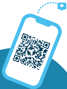
DIABAPP die Walliser App für Diabetespatienten

Wir stehen Ihnen gerne zur Verfügung, wenn Sie ein Gespräch möchten, oder andere Informationen wünschen.