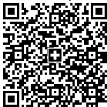
IBAN-QR-Code fürs E-Banking